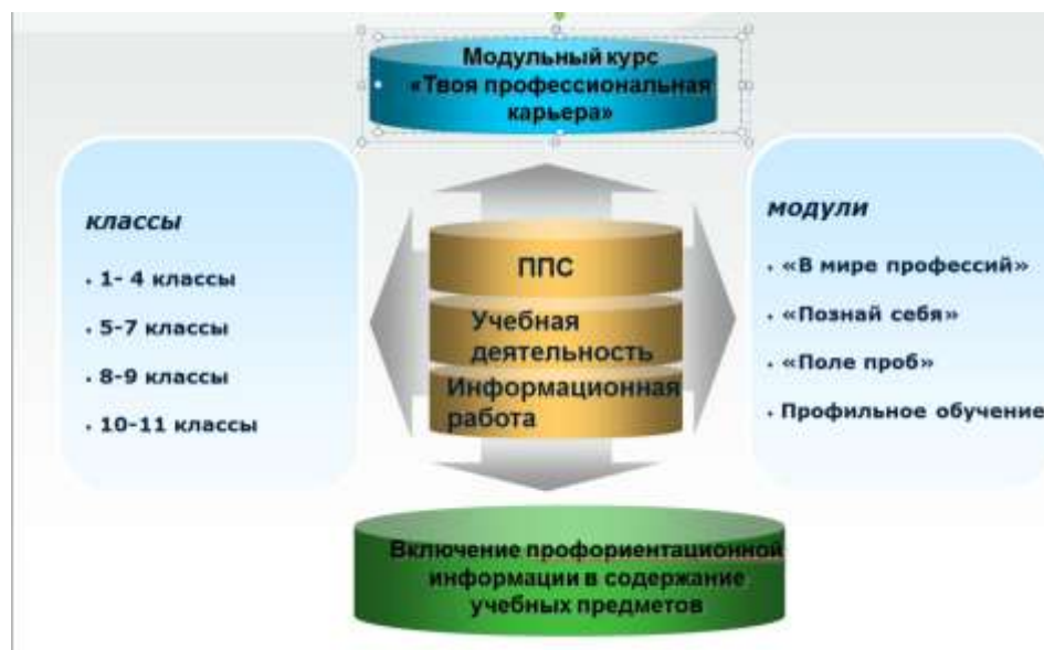
Рисунок 3. Направления деятельности по формированию профессионального самоопределения

На всех этапах сопровождения профессионального самоопределения обучающихся активно включаются социальные партнёры.