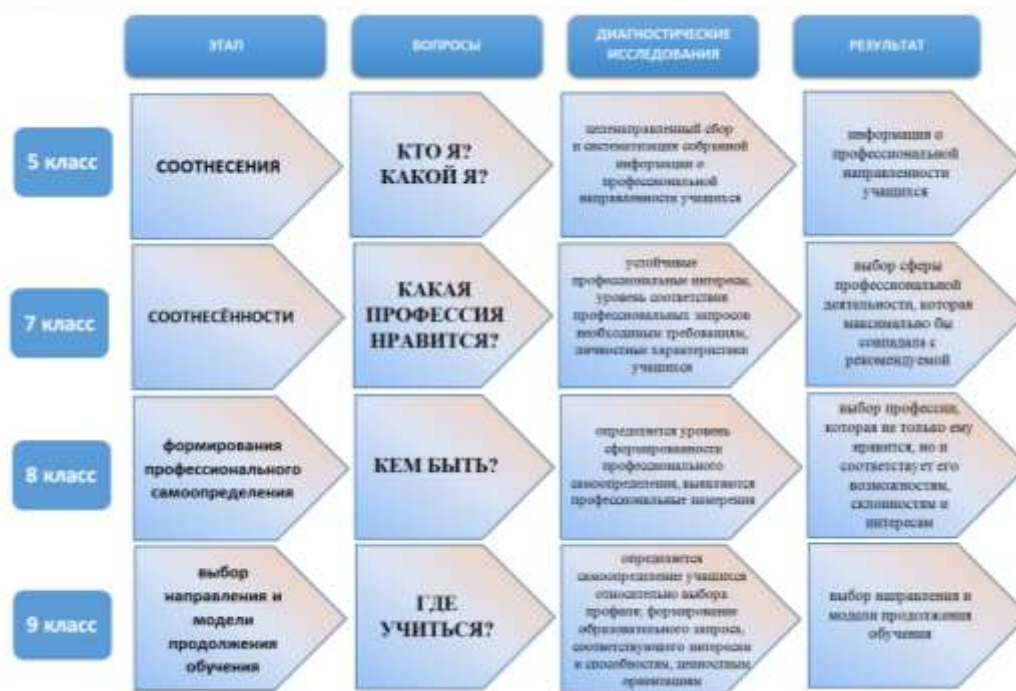
Рисунок 4. Направления деятельности по формированию профессионального самоопределения

Ответы на эти вопросы являются ступеньками формирования индивидуального образовательного маршрута каждого ребёнка, являющегося заключительным этапом профессионального самоопределения школьников, содержащим в себе осознанный выбор профессии и возможных путей ее приобретения.