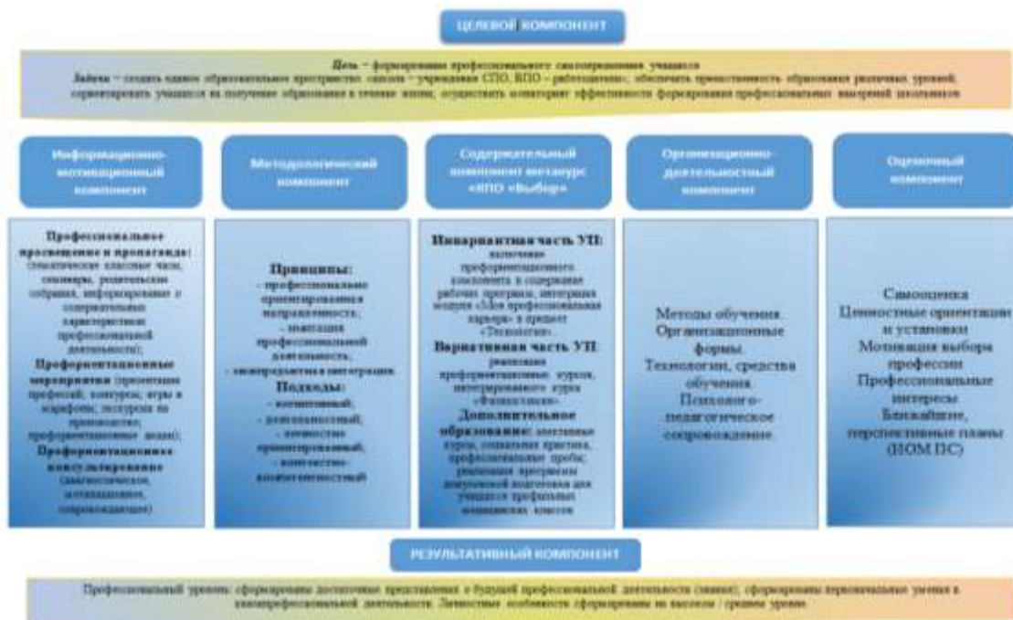
Рис. 1 Структурно-функциональная модель мониторинга профессионального самоопределения учащихся

Структура модели определена через направления деятельности каждого субъекта профессионального самоопределения для достижения единой цели и включает в себя следующие компоненты: